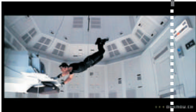
Tom Cruise i filmen Mission Impossible.

Er det mon den nordiske definition, han arbejder på?